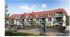
OPERATION BLOOM 93 Logements collectifs Rue Henri Robert-Nieu - MAROD EN BAROEUL