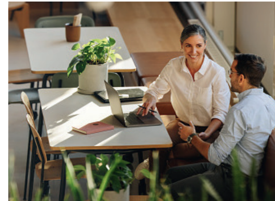
Photographies non contractuelles

Un emplacement stratégique dans les grandes métropoles, proche des aéroports, gares, axes routiers et quartiers d'affaires.